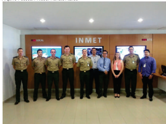
Oficiais do Exército visitam o Inmet