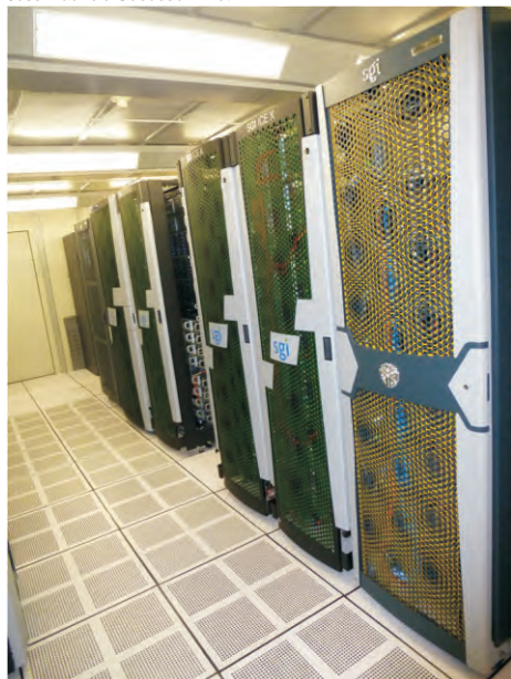
A nova configuração do cluster do CCMAD